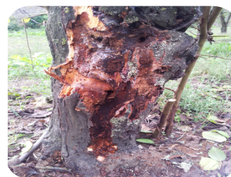
Cerambycidae delle drupacee ( Aromia bungii ): bello...ma può causare la morte dei nostri alberi da frutto.