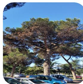
Cocciniglia tartaruga ( Toumeyella parvicornis ): dalle Americhe...una grande minaccia alle nostre pinete.