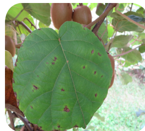
Cancro batterico del kiwi ( Pseudomonas syringae pv. actinidiae ): invisibile ... ma può distruggere i nostri impianti di kiwi.